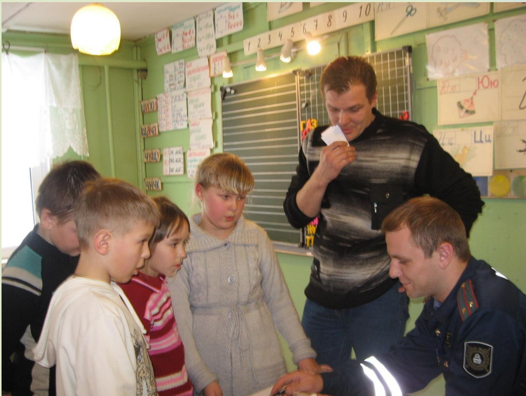
Подготовка к областному конкурсу «Безопасное колесо - 2012»