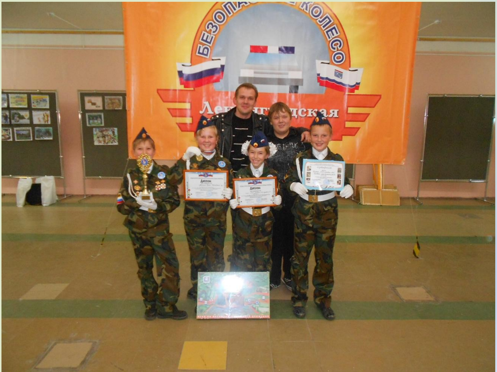
Областной конкурс «Безопасное колесо - 2012»